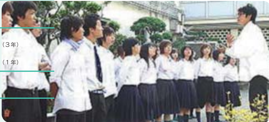
合唱コンクール発表前の練習