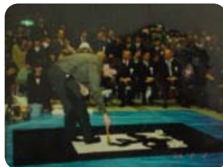
留学生が書道に挑戦