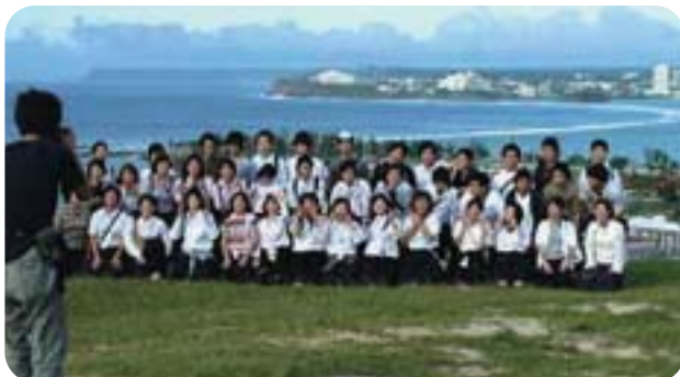
グアムへの修学旅行