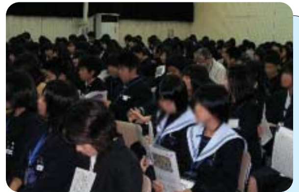
地元中学生対象のオープンスクール