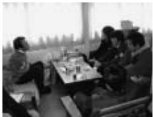
Caption for the image showing a group of people at a meeting.

Text block under '「クラブOB連絡会」' discussing the activities of the club alumni association.