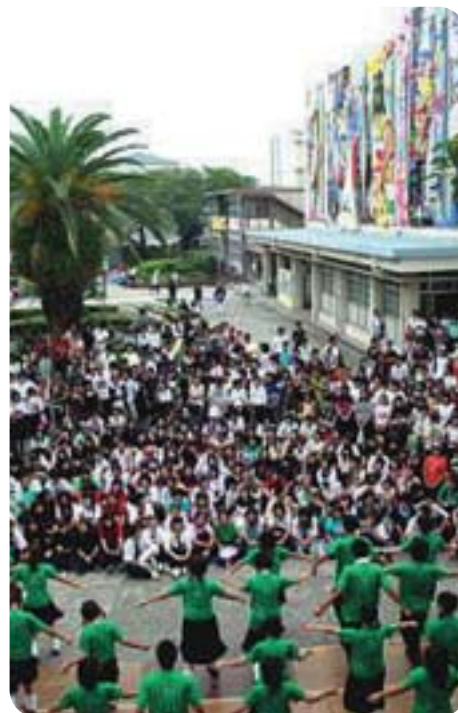
旭 高 祭